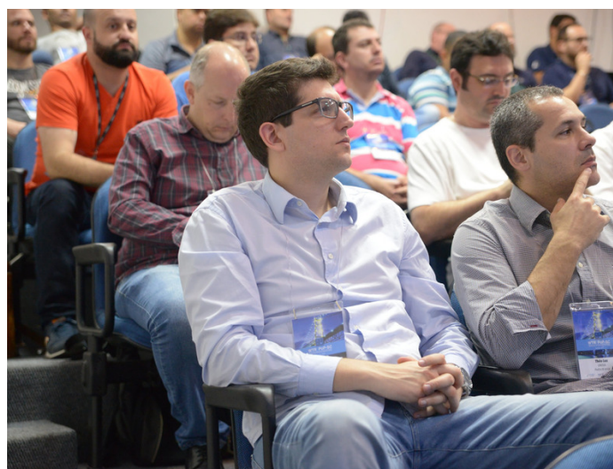
Fotos tiradas durante as palestras e cursos do WTR 2017 PoP-SC / REMEP-FLN